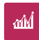
iVend Reporting & Analytics

La solución basada en la nube iVend Retail se ha diseñado para una implementación flexible. Añade módulos sobre una base "según sea necesario" para aumentar el conocimientos y capacidades, junto con la empresa.