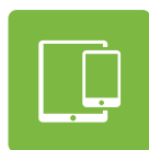
iVend Mobile POS